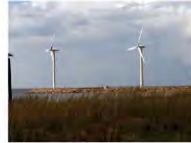
Akkuluvassa tuulivoimalaa Hailuodossa.

23.4.2019, 13.15 KUTTIPÄÄ YHESKÄLÄTÄ ENERGIÄ TUULIVOIMAA VOIMAA TUULESTA